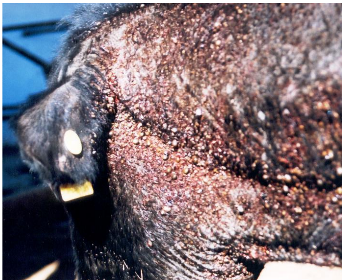
Figura 01. Animal altamente parasitado pelo carrapato dos bovinos

O carrapato dos bovinos há muito é conhecido pelos criadores, devido à estreita relação de convivência com os bovinos. O fato do carrapato se alimentar de sangue, o torna um sério inimigo dos animais. Além das atividades espoliativas, a fêmea, em especial, ingere de 0,5 ml a 3 ml de sangue durante sua vida parasitária, podendo um bovino adulto perder até 96 kg de sangue anualmente (TORRES, 1970). Em virtude desse parasitismo, o carrapato acarreta retardo do crescimento dos animais jovens, perda de peso, diminuição na produtividade de leite (,) e transmite a Tristeza Parasitária Bovina, doença que em algumas regiões e situações é responsável por alta mortalidade no rebanho.