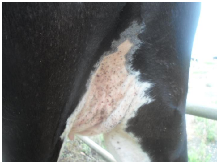
Figura 2. Fases de desenvolvimentos mais jovens do carrapato